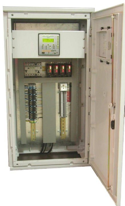
Verzija sa IP55 ku išem